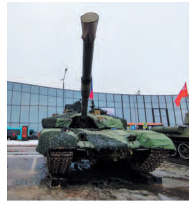
Гостей ждала выставка боевой техники

Центральным событием фестиваля стал первый региональный форум «Вместе победим». Его участники — ветераны СВО и родственники бойцов.