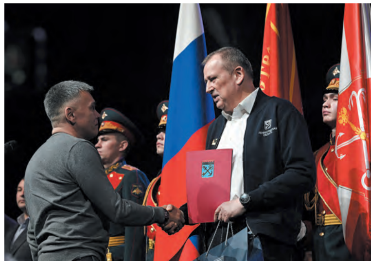
Александр Дрозденко наградил участников боевых действий и восстановления Донбасса