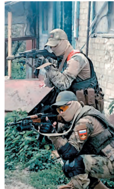
Волевые качества пригодились бойцу на фронте