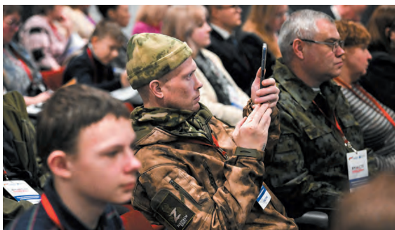
Участие в форуме приняли ветераны СВО, военные корреспонденты и волонтеры

КСЕНИЯ БОНДАРЕНКО