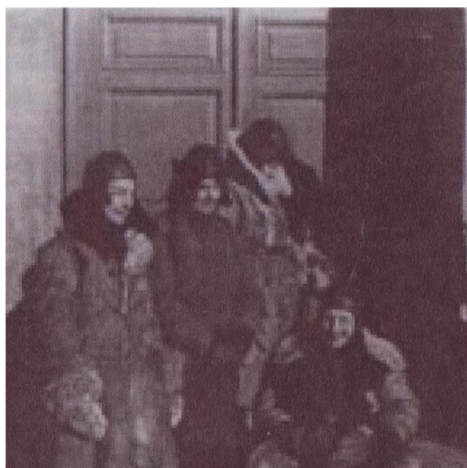
Вторая бригада альпинистов на маскировке шпиля Петропавловского собора, зима 1942-1943

в темной и холодной студии в составе струнного квартета. Их слушали не только Ленинград, но и Москва, и Стокгольм, и Лондон.