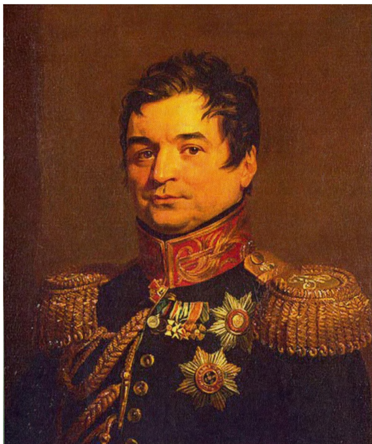
Портрет А.Д.Балашова кисти художника Д. Доу. 1819-1822 годы

Подпись на раме: А.Д.Балашевъ, Генераль Лейтенантъ Слева ниже плеча, подпись: G.Dawe pinxt ad vivum