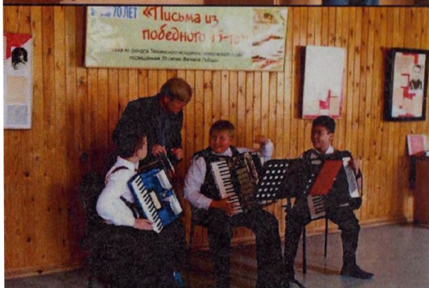
Выставка историко-краеведческих материалов из истории Тоснеского района времен Великой Отечественной войны Трио «Аккорд»