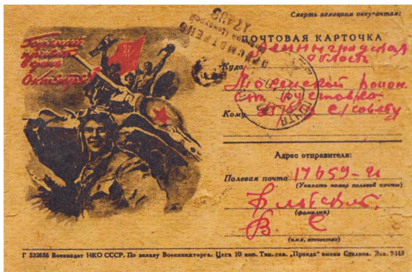
Почтовая открытка военных лет из фондов музея