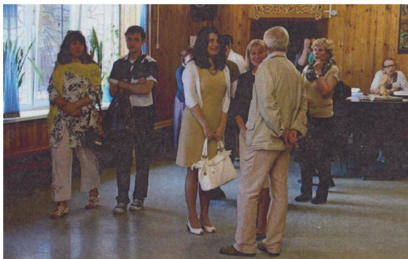
В фойе пред началом чтений