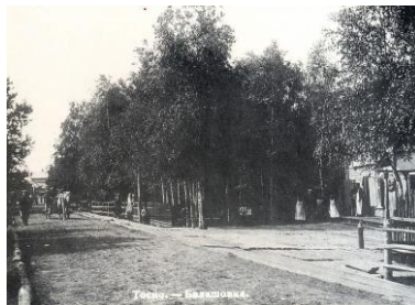
Тосно. – Балашовка.