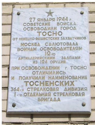
Пр. Ленина, д.34. Здание узла связи.