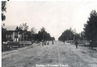
Тосно. – Главная улица.

О каждой из них кто-то из тосненцев может сказать: «родная улица моя».