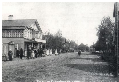
Тосно. – Станционная улица.