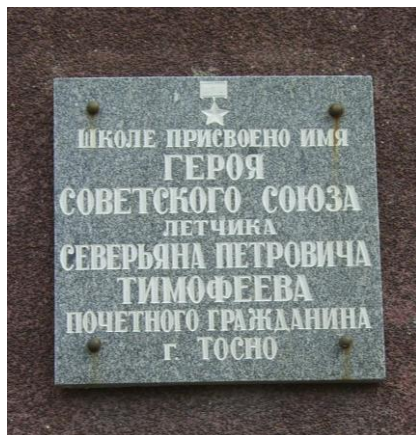
Ул. Горького, д. 5. Школа-лицей №3. Установлена в 1994 г.