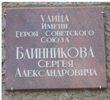
Ул. Блинникова, д. 12. Установлена в мае 2000 г.