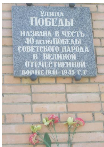
Здание поликлиники. Установлена 4 мая 1985 г.