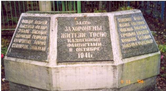
Жителям Тосно, казненным фашистами в октябре 1941 г. Городское кладбище.