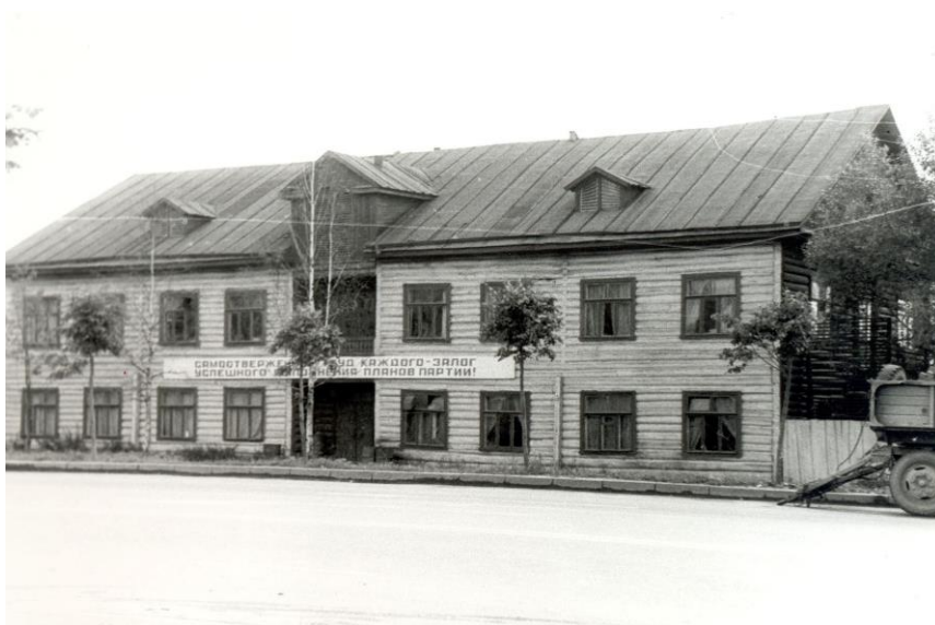
Артель «Знамя» (позже – филиал объединения «Пролетарский труд») на проспекте Ленина.