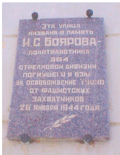
Ул. Боярова, д. 27. Дом юного техника. Установлена 25 января 1984 г.