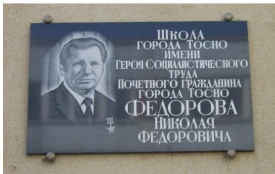
Ул. Горького, д. 15. Школа-гимназия №2. Установлена 12 июня 2003 г.