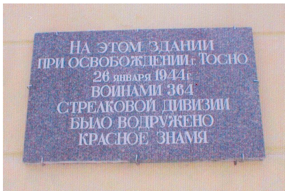
Ул. Боярова, д.27. Дом юного техника. Установлена в 1984 г.