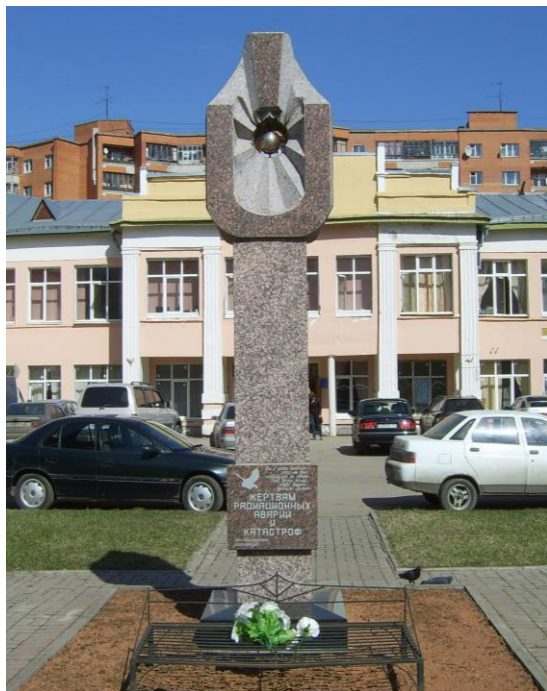
Жертвам радиационных аварий и катастроф. Пр. Ленина, д. 50. Старое здание администрации. Авторы: скульптор Е. Кузнецов, архитектор Е. Баталова, гранитчик М. Цеханович. Установлен 21 апреля 2001 г.