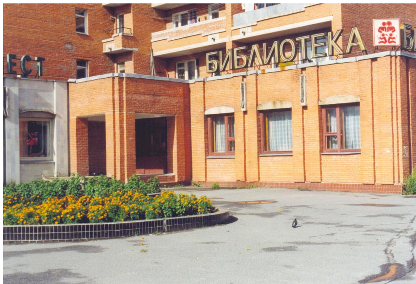
Библиотека семейного чтения на проспекте Ленина д.43

Замена старого электроосвещения на центральной улице Тосно длиной в 7 км новой линией из современных материалов, попутное улучшение электроснабжения 109 домов на проспекте Ленина.