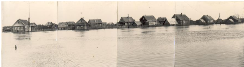
Разлив реки Тосны. 1966 г.