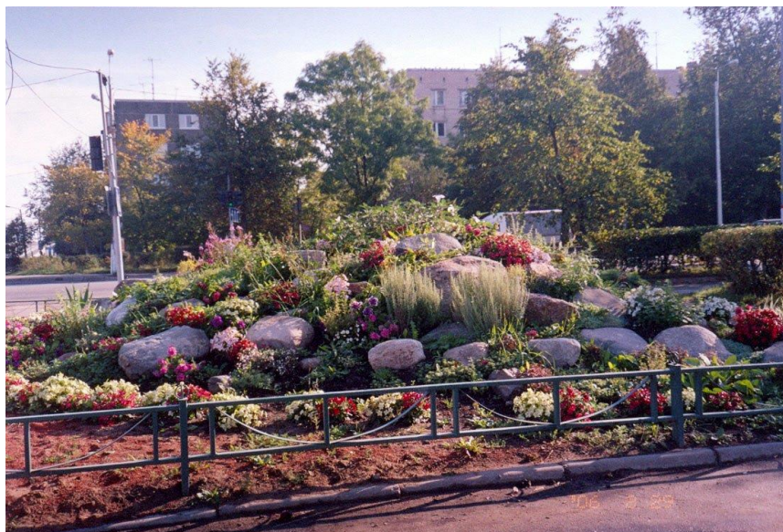
Альпийская горка на углу шоссе Барыбина и проспекта Ленина

Краткая справка о жизни и деятельности Б.М.Барыбина, приуроченная к 75-летию со дня рождения (16 октября 1925 г.).