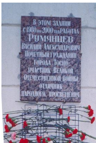
Ул. Боярова, д. 27. Дом юного техника. Установлена 27 января 2004 г.