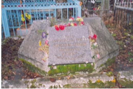
Захоронение воинов Красной Армии, погибших в 1919 г. Городское кладбище.