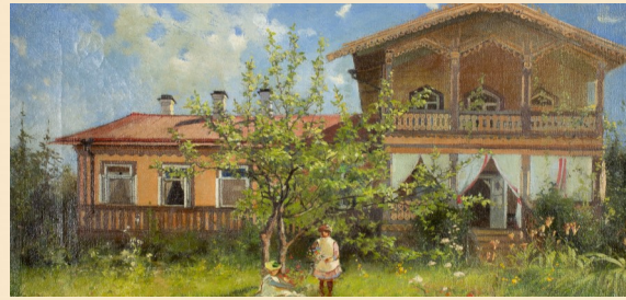
А.П. Рябушкин. Дача, 1888 г.

В 18 лет он был переведен в главный класс – натурный, где стал любимцем В. Г. Перова, к которому Андрей питал искреннее уважение и признавал как непререкаемый авторитет.