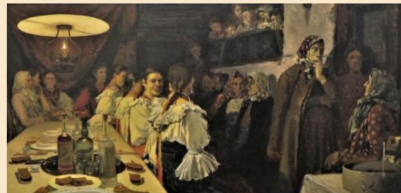
А.П. Рябушкин. Ожидание новобрачных от венца в Новгородской губернии, 1891 г.

Вскоре на ученической выставке появились его первые работы – «Сцена у дьячка» и «Крестьянская свадьба в Тамбовской губернии», которые сразу обратили на себя внимание знатоков живописи. Большое полотно – «Крестьянская свадьба...» приобрел для своей коллекции П. М. Третьяков. В Московском училище он получил прочную профессиональную основу живописи.