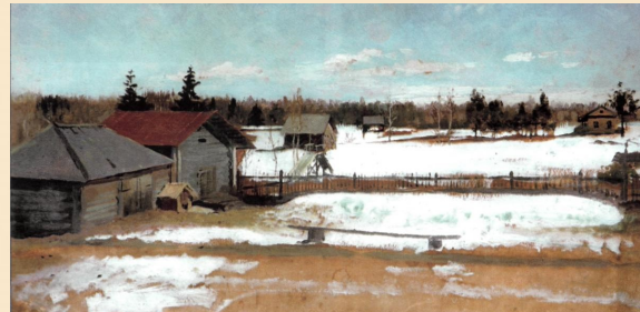
А.П. Рябушкин. Двор усадьбы Приволье, нач. 1890-х гг.