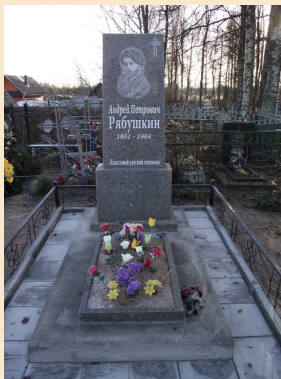
Могила А. П. Рябушкина в Любани, 2012 г.