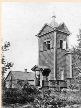
Никольская церковь в с. Добром. Фото нач. 20 в.

В 1904 году А.П. Рябушкин ушел из жизни, похоронен он был за алтарем Никольской церкви. Во время Великой Отечественной войны все деревни и усадьба Приволье, село Доброе были уничтожены. По инициативе членов Союза художников в 1957 году прах А. П. Рябушкина был перенесен на Любанское городское кладбище. В память о выдающемся русском художнике одна из улиц города Любань названа его именем.