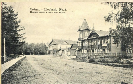
Любань. Открытка 20 в. Невское шоссе