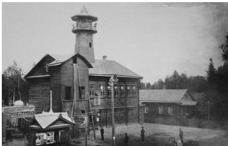
Пожарно депо пос. Саблино